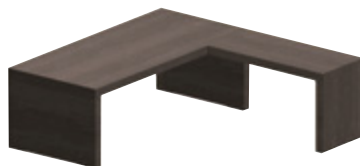
Разворот 130 x 60 см