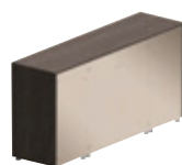
4 стеклянные дверцы