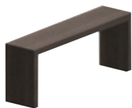
Консоль без дверец или разворот 190 x 45 см