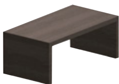
Отдельный стол 190 x 100 см 220 x 100 см