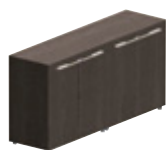
Креденции - В 71,8 x Ш 165 x Г 42,8 см 4 деревянные дверцы