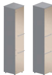
Узкий шкаф - Ш 40 x Г 42,6 см - 2 шт. 2 стеклянные дверцы В 197,3 см