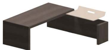
Полка для компьютера 112 x 63 см