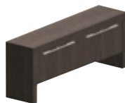
Консоль с деревянными дверцами 190 x 45 см