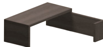
Стенка-разворот 130 x 49 см