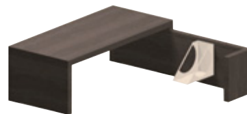
Подставка для СБ для стенки-разворота Г 26 x Ш 53 x В 42 см