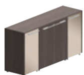
2 деревянные дверцы + 2 стеклянные дверцы