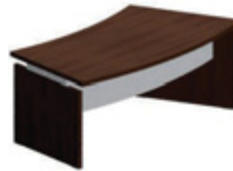
Изогнутый стол с металлической лицевой панелью 200 x 129 см