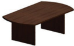
Стол для совещаний, деревянная лицевая панель 220 x 120 см деревянная лицевая панель 280 x 120 см