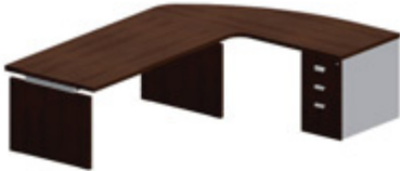
Приставной разворот на тумбе Г 80 см, правый или левый 205 x 92,5 см