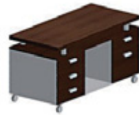
Передвижная сервисная тумба 127 x 58,2 см