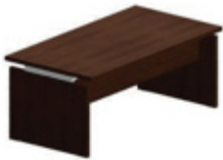
Прямоугольный стол с деревянной лицевой панелью 180 x 95 см 200 x 95 см