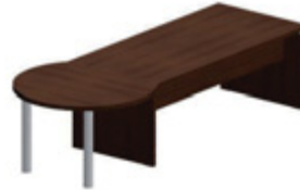
Приставной элемент 115 x 97 см