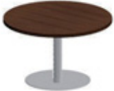
Круглый стол ø 120 см