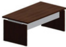
Прямоугольный стол с металлической лицевой панелью 180 x 95 см 200 x 95 см